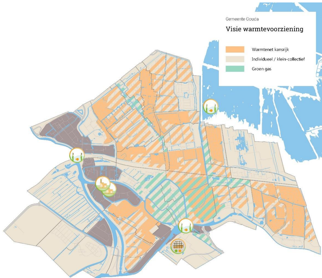
Afbeelding 2: warmteoplossingen

het grootste deel van de woningen uiteindelijk via een individuele oplossing aardgasvrij moet worden ( afbeelding 2, warmteoplossingen ).