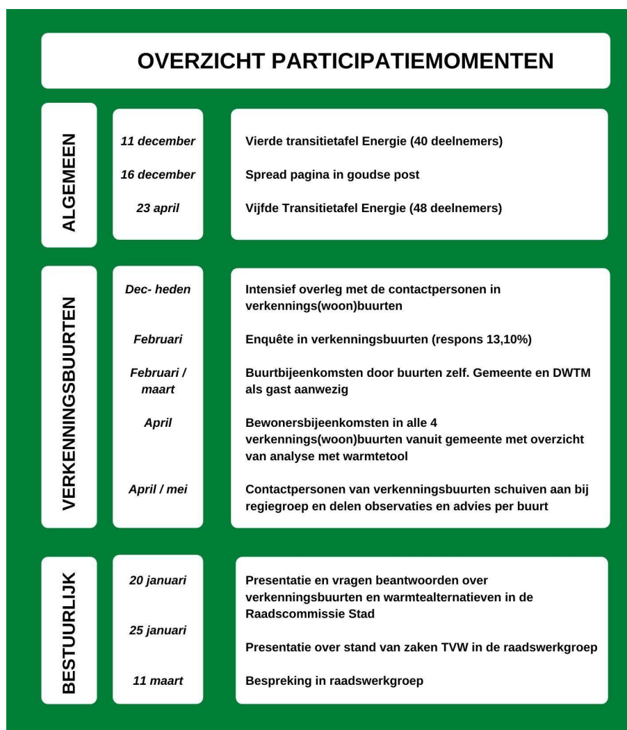
Figuur 1: Overzicht participatietraject verkenningbuurten

De fase van onderzoek in de verkenningbuurten is op 23 april 2021 afgesloten met de Vijfde Transitietafel Energie. Tijdens deze bijeenkomst werkten de deelnemers samen de algemene uitgangspunten (zie 2.2) uit in verschillende stellingen. Daarmee gaven deelnemers advies aan de regiegroep over voorwaarden om met de uitvoering van de warmtetransitie te starten.