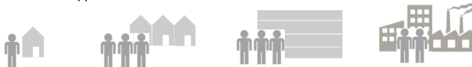
Figuur 2: Schematisch overzicht support structuur

De support is doelgroep specifiek. Het Duurzaam bouwloket is het huidige energieloket van de gemeente Gouda en fungeert voor alle doelgroepen als eerste oriëntatie, daarnaast biedt de website Maak Gouda Duurzaam concrete handvatten en inspiratie. Na de oriëntatie is een analyse noodzakelijk om te kijken wat specifiek voor de huurder, huiseigenaar, het collectief, VVE of het bedrijf haalbaar is. Deze analyse of haalbaarheidsonderzoek is afhankelijk van veel factoren en leidt per doelgroep tot een ander plan van aanpak. Vandaar dat de support hierbij verschillend is;